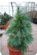
Pinus schwerinii 'Wiethorst'

Jedná se o mezidruhového křížence P. wallichiana x P. strobus . Strom je vysoký 10-15 metrů. Větve vodorovně odstávají, větévky jsou pokroucené. Pupy pryskyřičnaté. Jehlice po 5 ve svazečku, dlouhé 10-12 cm, jemné, tenké, převisající. Šišky 8-15 cm dlouhé, 4 cm široké, hnědé až šedavé. Tento druh borovice časně plodí. Potřebuje slunná stanoviště, na půdu je jinak nenáročný. Mrazuvzdornost: -34°C.