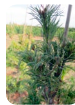
Pinus strobus 'Tortuosa'

Pomalou rostoucí kultivar dosahující výšky 10-12 m a vyžadující slunná stanoviště, s jemnými, kroucenými modrozelenými jehlicemi, asi 3-4cm. Mrazuvzdornost: -34°C.