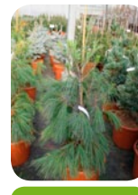
Pinus strobus 'Pendula'

Vzrůstem nepravidelný kultivar se většinou pěstuje vyvazovaný. V tom případě je jednokmínkový. Bez vyvázání tvoří více kmínků a růst je spíše keřovitý. Výška závisí na způsobu pěstování. Dosahuje šířky až 2 metry. Větve odstávají do dálky a pak převisají až k zemi. Mrazuvzdornost: -34°C.