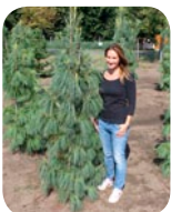
Pinus resinosa 'Nana'