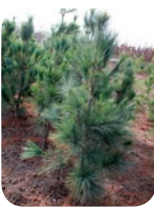
Pinus strobus 'Fastigiata'

Růst vzpřímený, sloupovitý, později až široce kónický. V dospělosti se výška této borovice může pohybovat kolem 15 metrů výšky a 5 metrů šířky. Jehlice jsou až 10 cm dlouhé, zelené až zelenomodré. Mrazuvzdornost: -34°C.