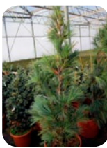
Pinus strobus 'Densa'

Tato borovice dosahuje ploše kulovitým, hustým a pravidelným vzrůstem výšky 1,5-2 metry, díky tomu je vhodná i do nádob. Jehlice ve svazečku po 5 jsou až 10 cm dlouhé, tenké, jemné a namodralé zelené. Vyžaduje slunné stanoviště a živnou propustnou půdu. Mrazuvzdornost: -34°C.