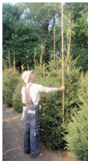
Inventarizace smržických konifer