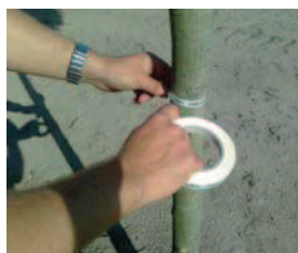
Inventarizace stromů v Obříství