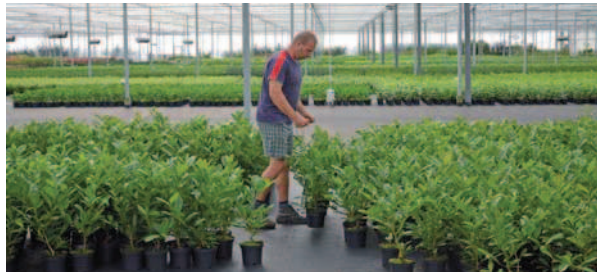
Rozvolňování pěstebních tabulí