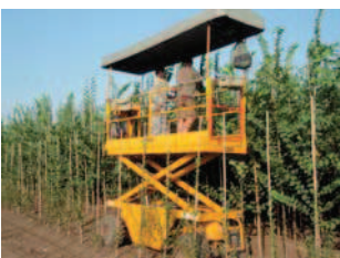
Vyvazování terminálů ve Smržicích